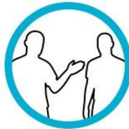
Eine andere Person